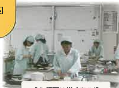
食物調理技術検定2級

「やめっこ未来館」を中心に子供や高齢者と交流します 介護や保育の知識とコミュニケーション力を身につけます