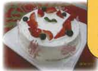
フードデザイン実習

「圃場から食卓まで」をテーマに、栄養、食品、献立、調理、テーブルコーディネートなどに関する知識と技術を習得し、食事の総合的なデザインについて学習します