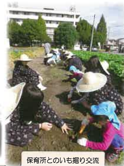
保育所とのいも掘り交流