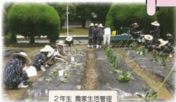
2年生 農家生活管理