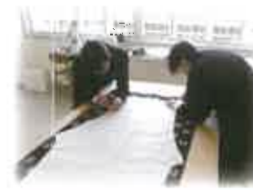
1年生 かすり実習服製作