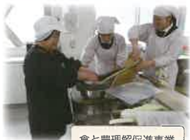
食と農理解促進事業