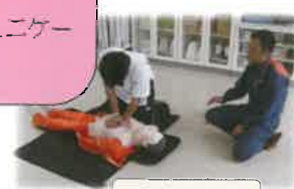
救急救命法講習会