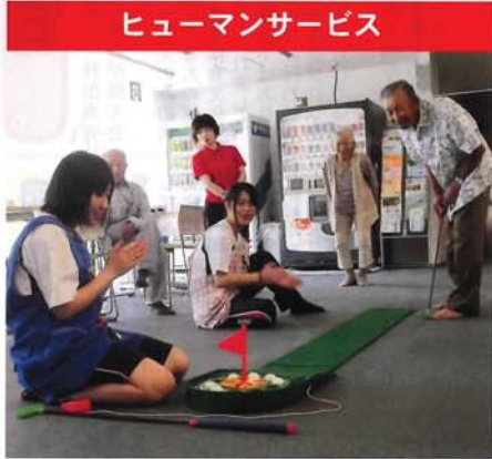
ヒューマンサービス

保育から高齢者の介護などに関する知識と技術を身に付けます。フードデザインでは、「現場から食卓まで」をテーマに食物に関する知識と技術を習得し、食物の総合的デザインについて学習します。