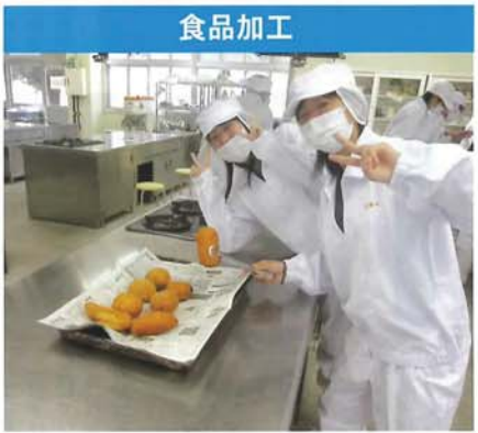
食 品 加 工

「生命」と「食」を学びます。動物科学専攻では乳牛や鶏などの産業動物やポニーなどの社会動物の生理・生態、飼育方法を学習し、飼育管理に必要な基礎的・基本的な技術や知識を学習します。県内の高校で唯一、乳牛を飼育しており、乳しほりが体験できます。