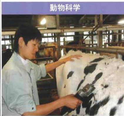
動 物 科 学

施設園芸による草花・野菜の知識・栽培技術および経営とバイオテクノロジー、コンピュータの利用を学びます。