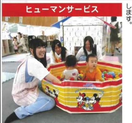
ヒューマンサービス