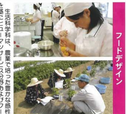
フー ド デ ザ イ ン

生活科学科は、農業で培った豊かな感性を基にヒューマンサービス分野およびフードデザイン分野に分かれ学習します。農業の基礎・基本を学び、本校独自の「農家生活管理」の中で農業と家庭の融合を目指し、科学的な視野に立ってプロジェクト学習を行います。また農業の実習では、1年生の1学期に「被服製作」で作り上げた「かすりの実習服」を着用しています。3年間の実習を行います。