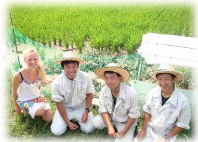
生産技術科の3年生