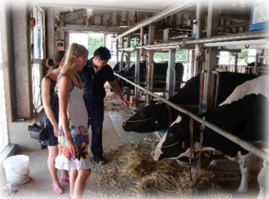
北山農場の牛舎を見学