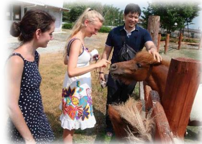
北山農場のポニー