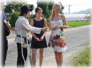
フランス語で通訳